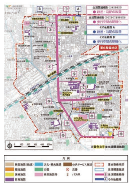
凡例 旅客施設(鉄道) 文化・観光施設 公共サービス施設 重点整備地区 福祉施設 公園 交通 生活関連施設 医療施設 商業施設等 2 バス停 生活関連経路 教育施設 その他経路

・西大路地区バリアフリー移動等円滑化基本構想の推進 (生活関連施設、生活関連経路及び重点整備地区の区域)