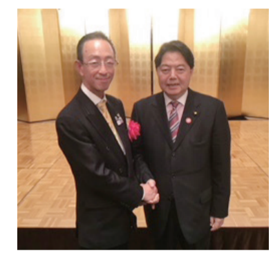
林芳正文部科学大臣と面談