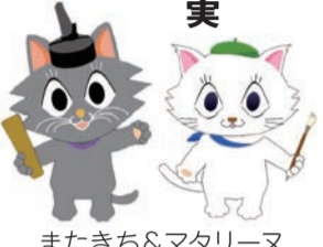
またき&マタリーヌ