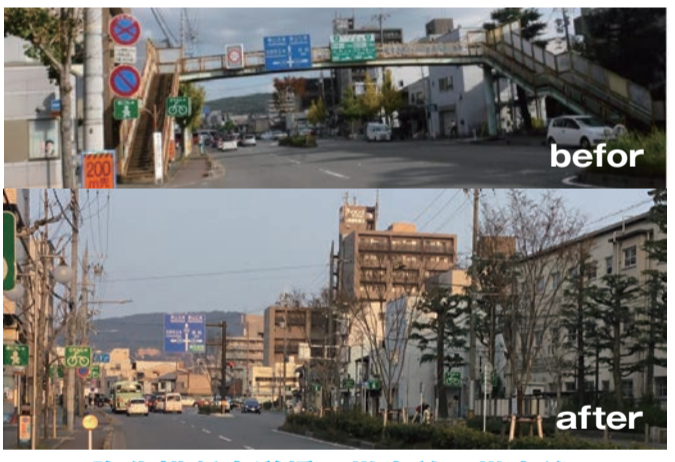
陶化横断歩道橋 撤去前、撤去後