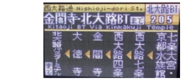
H34年度までに全車両に導入