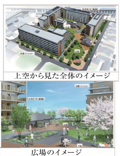
上空から見た全体のイメージ 広場のイメージ 市有財産の有効活用として京都市初の市営住宅と分譲マンションの共存

西大路地区バリアフリー移動等円滑化基本構想の推進（生活関連施設、生活関連経路及び重点整備地区の区域）