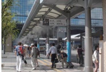
H31年度に全のりば完成

13・43号系統と鉄道との乗継利便性向上 京都駅バスターミナルBのりばにドライミスト増設