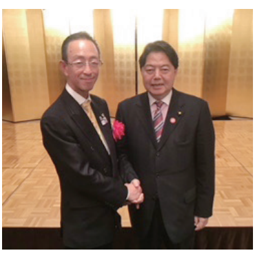
林芳正文部科学大臣と面談