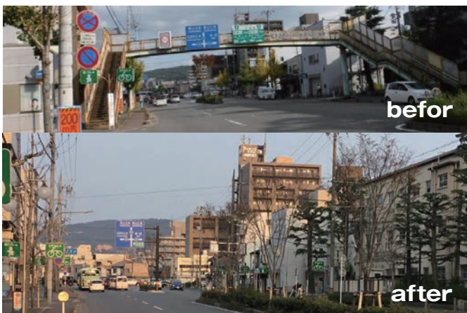
陶化横断歩道橋 撤去前、撤去後